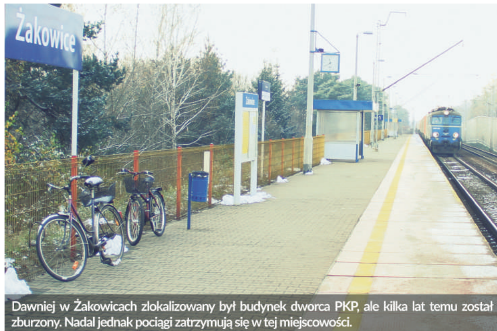
Dawniej w Żakowicach zlokalizowany był budynek dworca PKP, ale kilka lat temu został zburzony. Nadal jednak pociągi zatrzymują się w tej miejscowości.

W kolejnej odsłonie cyklu #NaszeSolectwa przedstawiamy miejscowości Różyca i Żakowice. To najliczniejsze sołectwo w gminie Koluszki. Zamieszkuje je około 1.800 mieszkańców.